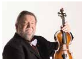
Konzerthalle / Gartensaal

Das Orchester wird an diesem Nachmittag ein Konzertprogramm präsentieren, bei dem die bekanntesten und beliebtesten Kompositionen aus dem Programm des Jahres 2024 noch einmal zu hören sein werden.