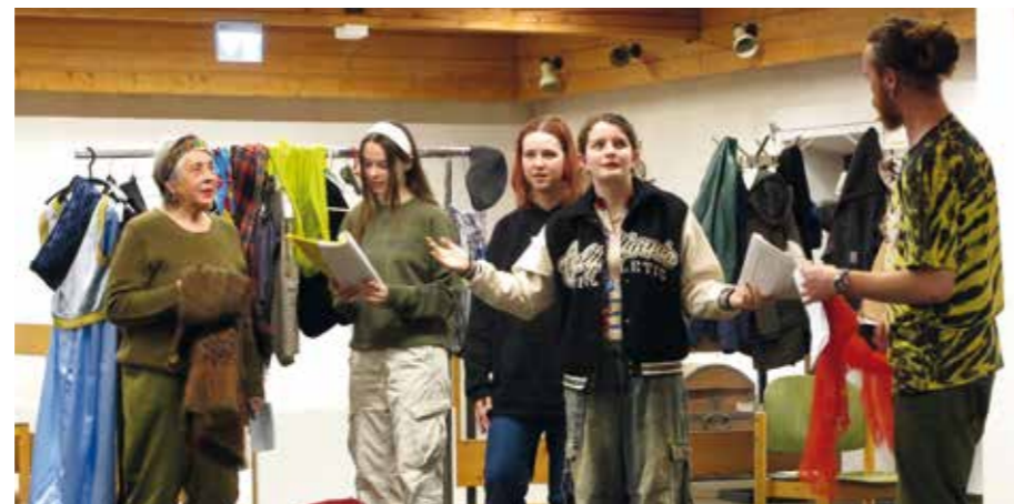
Die Darsteller bei der Probe von „Zeus & Consorten“

Im „Drachenreiter“ geht es um die abenteuerliche Reise des silbernen Drachens